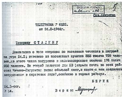
Телеграмма Берии Сталину о ходе операции по выселению чеченцев и ингушей 24.02.1944 г.

«сходы» по случаю дня Красной армии, которые были оцеплены солдатами НКВД, вооруженными автоматами и пулеметами. Таких «сходов» не было только в тех горных селениях, доступ к которым был затруднен в связи с отсутствием пригодных дорог или «разбросанным» их расположением. Основным условием эф-