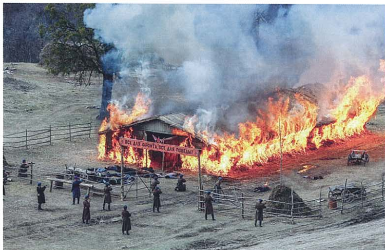
Массовое убийство карателями жителей Галанчожского района в селении Хайбах 27 февраля 1944 г. Реконструкция событий.